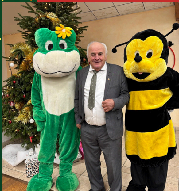
Deux mascottes été présentes lors du Noël des enfants.

Un grand merci à Monsieur DOOM, Maire de Saint-Aubin-sur-Gaillon, qui, sans son accord pour le prêt de la salle des fêtes, cet événement n'aurait pas eu la même saveur.