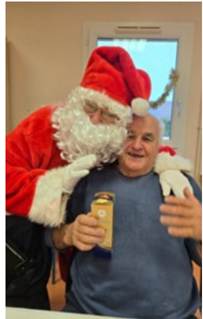
Repas de Noël du 13/12/2025

Nous nous réunissons tous les jeudis après midi à partir de 14 heures pour jouer à différents jeux : belote, nain jaune, rumikub ...etc, et partager de délicieux gâteaux faits chaque semaine par un ou une adhérente différent.