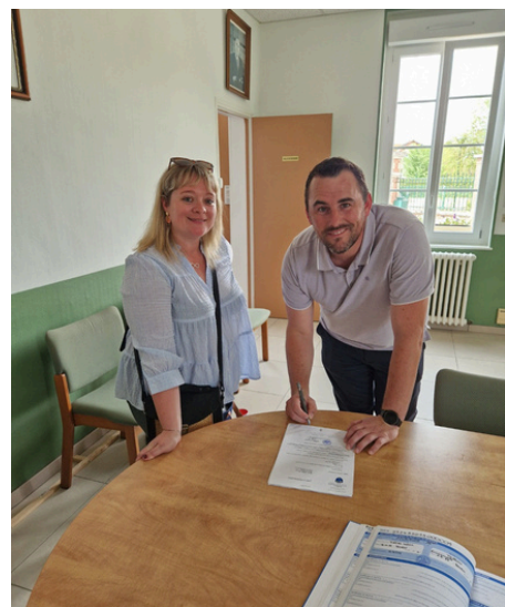
Un 2e PACS s'est tenu en Mairie. Les personnes n'ont pas souhaité apparaître dans le bulletin