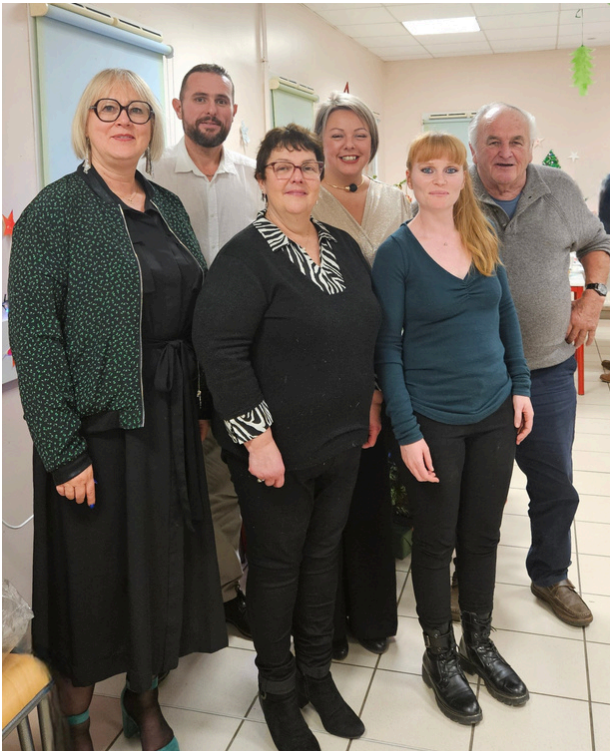
Le Maire et ses agents communaux. Deux agents absents sur la photo